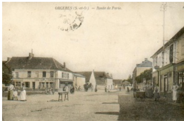
Orgerus centre du village

Sur le recensement de la population de 1911, on recense à Orgerus une soixantaine de commerçants et artisans.