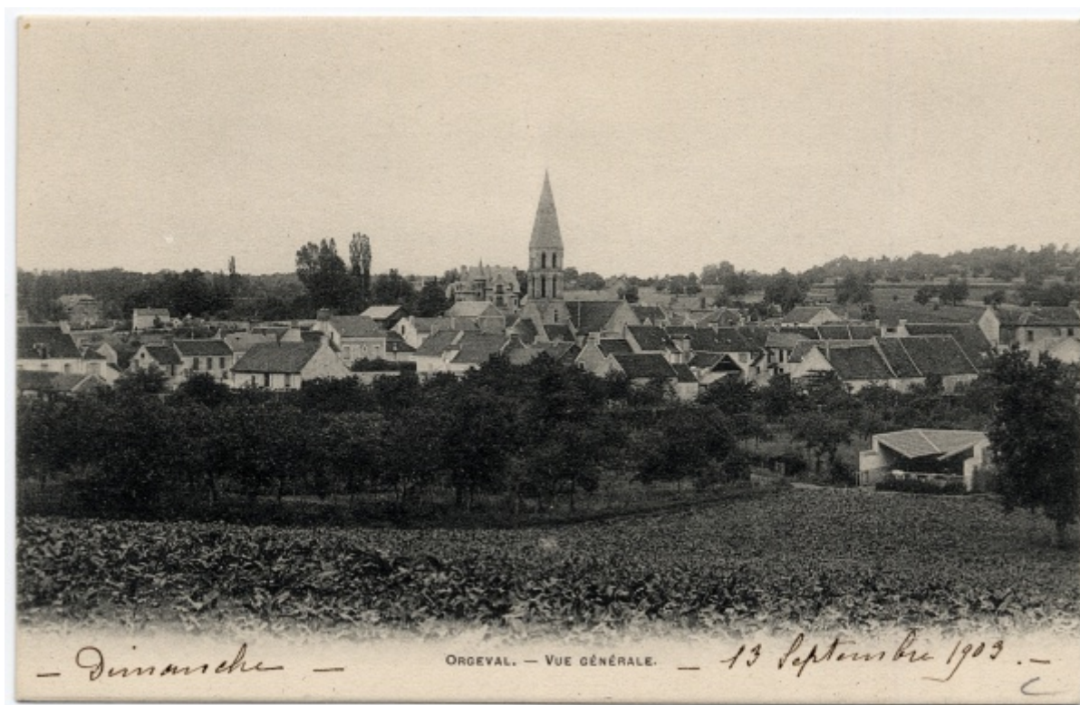
Orgeval - Vue générale