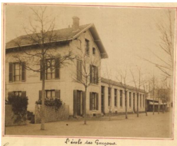
Ecole des garçons de Chatou, ADY 1T mono 3/8