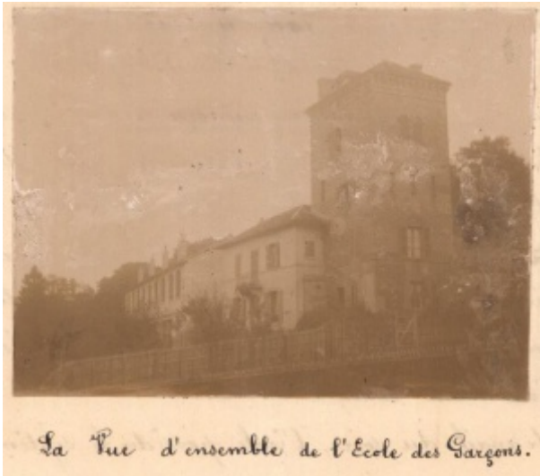
Ecole des garçons de Bougival, ADY 1T mono 2/19

Gaston Brice a suivi les leçons de l'école Normale d'instituteurs de Versailles jusqu'en 1908, année d'obtention de son Brevet supérieur.