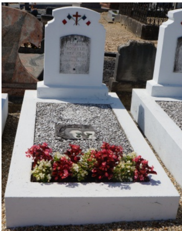
tome de Georges Botelle dans le cimetière de Triel