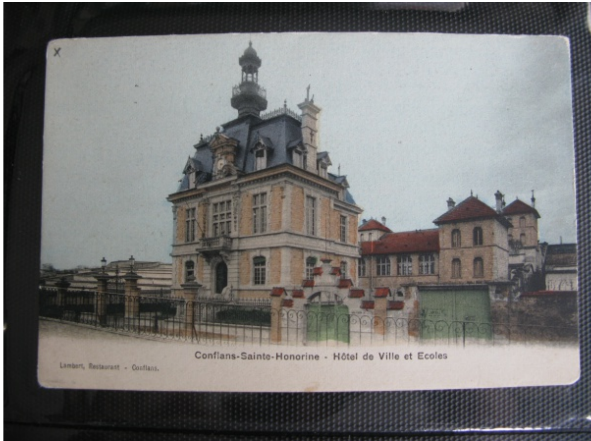
La mairie et les écoles de Conflans-Sainte-Honorine vers 1900.

En 1880, il enseigne à Sartrouville et de ce fait, est dispensé de ses obligations militaires [4] . Il exerce son métier d'instituteur à Conflans-Sainte-Honorine de 1884 à 1917, tout d'abord à l'école située sur l'actuelle place Fouillère, puis à partir de 1896 dans le bâtiment neuf situé derrière la mairie dont il supervisa les travaux en tant que secrétaire de mairie.