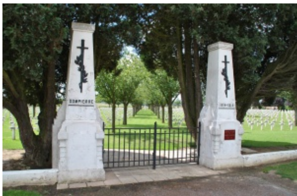
Nécropole de Dompierre-Becquincourt dans la Somme

Engagé volontaire pour trois ans le 5 janvier 1911 au titre du 3e régiment de cuirassiers. Arrivé au corps le 6 janvier 1911. Cavalier de 1ère classe le 21 février 1913.