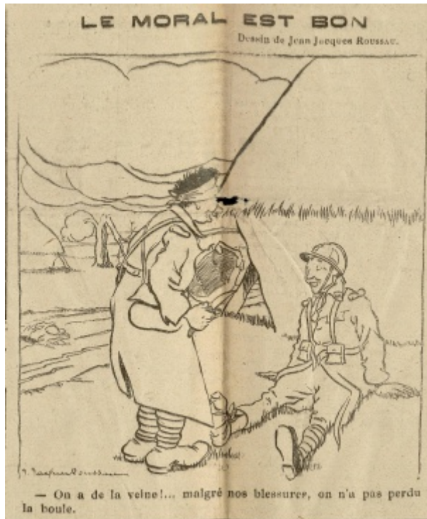
Illustration "Le moral est bon", Le Petit Mantais, 18 avril 1917, p.3 - ADY PER1063/29

De Le Wiki de la Grande Guerre Aller à : navigation, rechercher