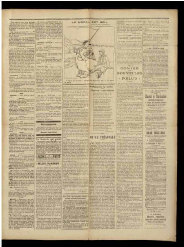
Le Petit Mantais, 18 avril 1917, p.3 - ADY PER1063/29

Les soldats sont pour l'un blessé à la tête, l'autre au pied, sans chaussure, sans casque. Il n'y a donc aucun souci de réalisme. Cependant ce document soulève la question de fond de l'épuisement psychologique des soldats et de leur santé mentale.