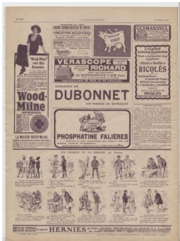
« Les croquis de la semaine » par Henriot, L'Illustration n°3737 du 17 octobre 1914

De Le Wiki de la Grande Guerre Aller à : navigation, rechercher