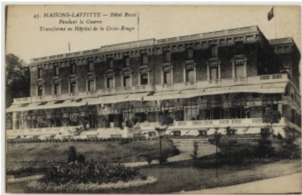
Hôpital de Maisons-Laffitte, ADY 3Fi 137 53

De Le Wiki de la Grande Guerre Aller à : navigation, rechercher