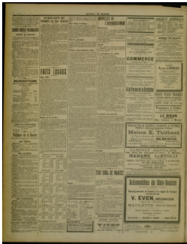
Le Journal de Mantes, 9 décembre 1914

De Le Wiki de la Grande Guerre Aller à : navigation, rechercher