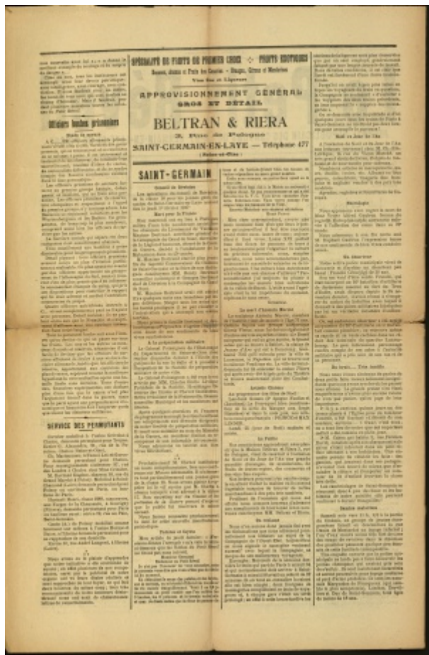
Le service des permutants. Le Petit Réveil, 21 décembre 1916. AD78 - PER 1102/1

De Le Wiki de la Grande Guerre Aller à : navigation, rechercher