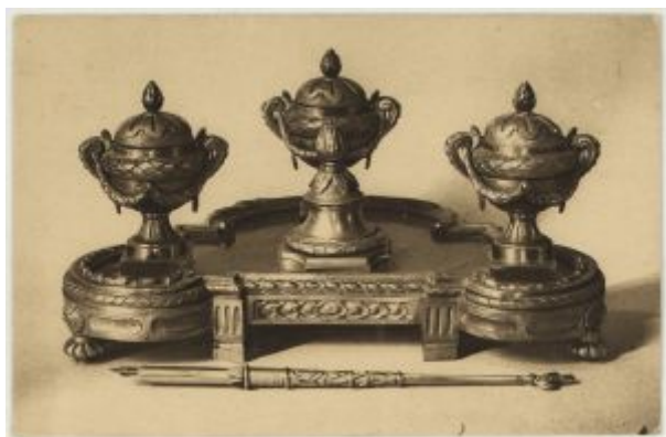
Carte postale des années 1940 : "Encrier et porte-plume ayant servi à la signature du traité de la paix de 1919"

Pour clore ces quatre années de Chronique du centenaire, cent ans et un mois après la signature de l'armistice, nous avons choisi cette affiche publiée quelques jours après la signature du Traité de Versailles.