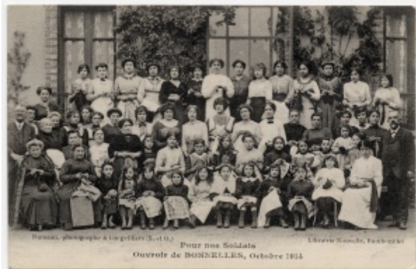
Carte postale - Ouvroir de Bonnelles

De Le Wiki de la Grande Guerre Aller à : navigation, rechercher