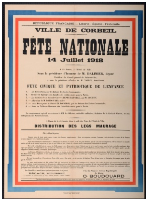
Affiche du 14 juillet 1918 à Corbeil - AD78 cote 103J17

De Le Wiki de la Grande Guerre Aller à : navigation, rechercher