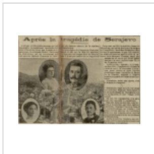
Détail du Petit Mantais, 5 juillet 1914