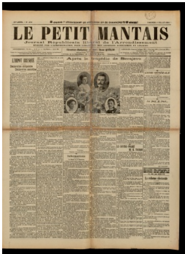
Le Petit Mantais, 5 juillet 1914

De Le Wiki de la Grande Guerre Aller à : navigation, rechercher