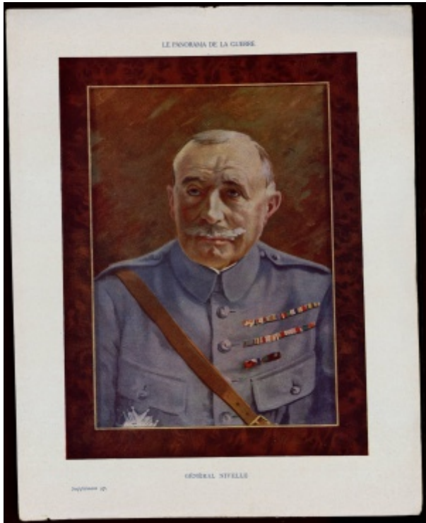
Portrait de Nivelle, planche illustrée. ADY 23FI 1

Le 16 avril 1917 à 6 heures du matin, l'armée française lance une vaste offensive sur environ 25 kilomètres de front le long du Chemin des Dames. C'est l'offensive « Nivelle » du nom du général qui a planifié cette attaque et qui reste dans les mémoires de la Grande Guerre associé aux mutineries de 1917.