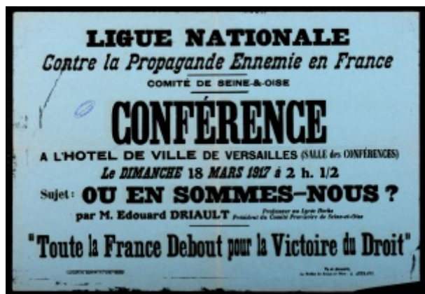
Affiche "Où en sommes-nous ?" - ADY 103J15

De Le Wiki de la Grande Guerre Aller à : navigation, rechercher