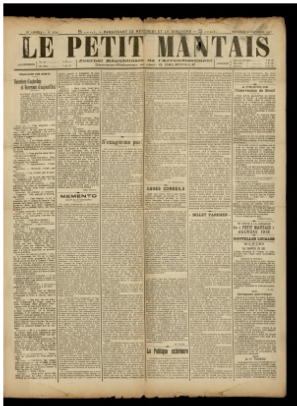
« Guerriers d'autrefois et guerriers d'aujourd'hui », Le Petit Mantais, 14 novembre 1917. ADY - PER 1063

De Le Wiki de la Grande Guerre Aller à : navigation, rechercher