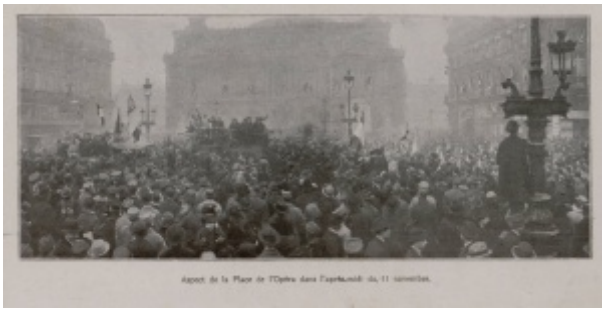
« Aspect de la Place de l'Opéra dans l'après-midi du 11 novembre ». L'illustration, 14 décembre 1918, p. 556. AD78 cote PER 3550/8

Afin d'évoquer cet évènement nous avons choisi de vous présenter cette très belle photographie peu connue et dont le cadrage nous a particulièrement séduit.