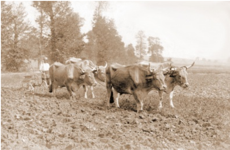
Attelage pour les labours à Saint-Nom-la-Bretèche en 1909 [1]

De Le Wiki de la Grande Guerre Aller à : navigation, rechercher