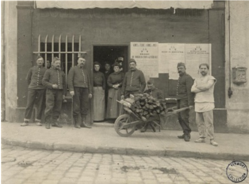
Boulangerie Berson à La Bretèche, aujourd'hui "Les Délices de Saint-Nom" [3]

Le 1 er août 1914, la mobilisation touche 27 classes soit 140 hommes. Par la suite, 5 autres classes soit 24 hommes seront concernées. Nombre de travailleurs vont cruellement manquer dans les fermes, l'artisanat et le commerce. En effet, ces 164 soldats représentent 77% des hommes actifs, et 41 d'entre eux ne reviendront pas !