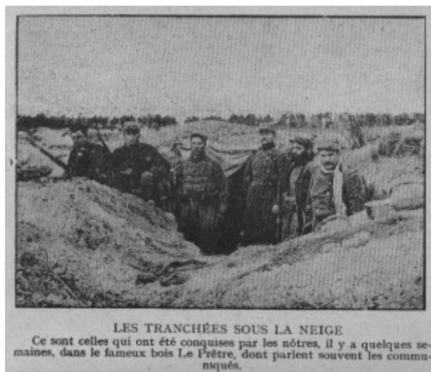
Secteur de Bois le Prêtre_ Février 1915

Incorporé à compter du 27 novembre 1913. Arrivé au corps le 28 novembre 1913. Soldat de 2e classe le dit jour.