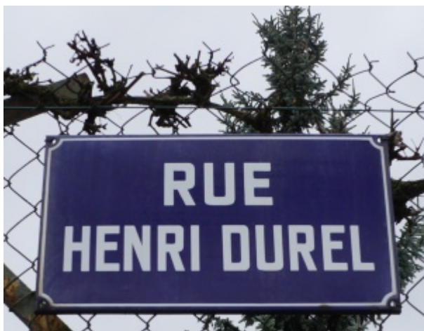
Rue Durel à Triel