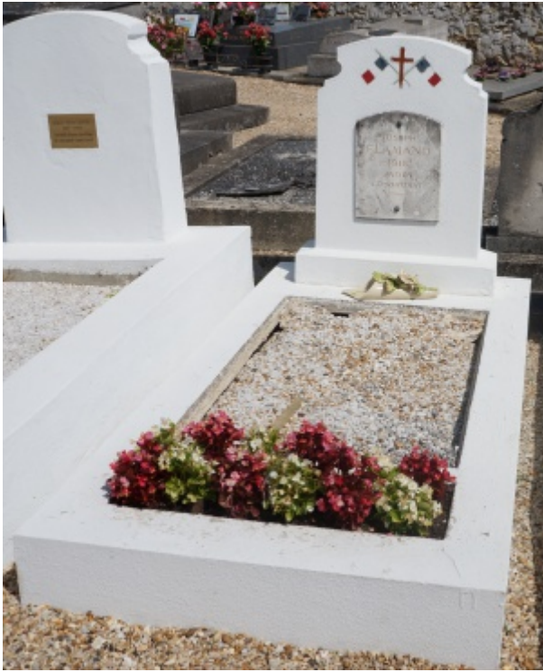
Tombe de Joseph Flamand dans le cimetière de Triel