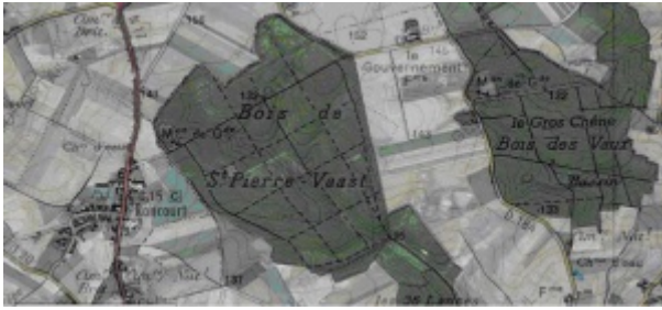
Bois de St Pierre-Vaast

Incorporé à compter du 4 septembre 1914. Arrivé au corps le 4 septembre 1914. Soldat de 2e classe, le dit jour. (incorporation provisoire).