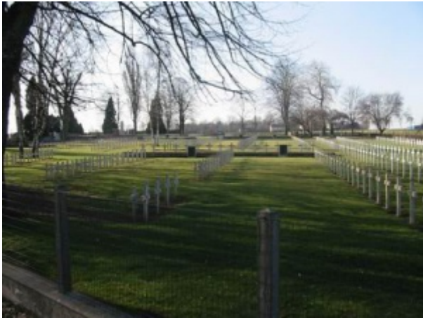
Nécropole Nationale Dieuze

Incorporé le 9 octobre 1907 au 1er bataillon de chasseurs à pied. Arrivé au corps et soldat de 2e classe le 9 octobre 1907.