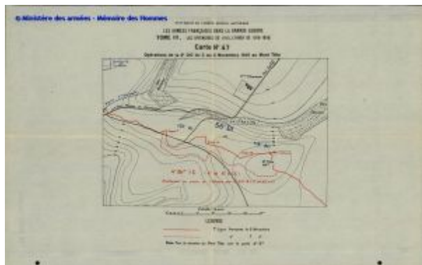
50.000e. - Opérations de la 2e D.I.C. du 3 au 6 novembre 1915 au mont Têtu.

De notre côté, nous préparons à la fin de novembre, contre le mont Têtu, point le plus élevé de la Main de Massiges, une attaque avec emploi de nappes de gaz, envisagée depuis les premiers jours du mois. L'exécution en est confiée à la 1 re 6 e division coloniale (1 er corps colonial), avec mission de reprendre la cote 19g que les Allemands nous ont enlevée le 3 novembre. Mais, à partir du 29 novembre, le temps devient affreux; le dégel et la pluie rendent très difficile le transport des appareils à gaz.