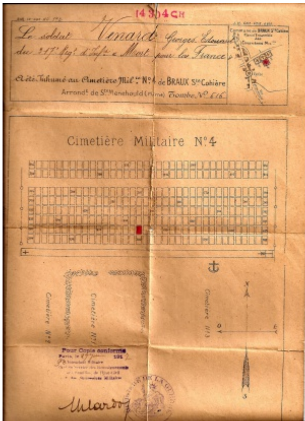
Cimetière Militaire - 1917

Blessé le 10 janvier il décède le 15 janvier 1916 à l'ambulance 8/4 à Braux-Sainte-Cohière (51). Il est inhumé au cimetière militaire N°4 de Braux-Sainte-Cohière puis transféré le xx/xx/xxxx au cimetière de la Hauteville (78) où il repose désormais aux cotés de son épouse.