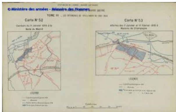
5.000e. - Affaires des 9 janvier et 11 février 1916 à Maisons-de-Champagne.

Tome III. Annexes 4eme Volume (Annexes 2353 et 2355 , pages 605-607) [5]