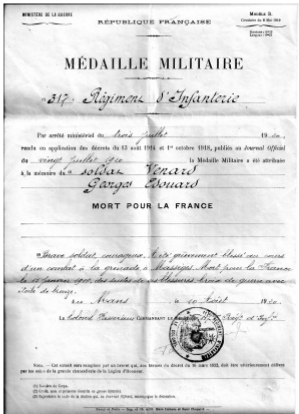
Médaille Militaire - 1920

attaques d'infanterie avec emploi de liquides enflammés. Leur but semble être de nous rejeter de la crête butte du Mesnil, Maisons de Champagne, cote 199, ou tout au moins d'y conquérir des observatoires, mais ils ne parviennent à prendre pied qu'en deux points de nos positions, au nord-est de la butte du Mesnil et au sud-ouest de la ferme Chausson. Les contre-attaques déclenchées le 10 et le 11 par le 5ème corps dans le secteur de la butte du Mesnil et par le 4ème corps dans le secteur du mont Têtu nous rendent une partie du terrain perdu. L'ennemi semble avoir mis en ligne des éléments appartenant à deux ou trois divisions appuyés par environ quatre-vingts batteries, et avoir subi de fortes pertes. Les nôtres sont également sérieuses, et s'élèvent à plus de 2.000 hommes, répartis à peu près également entre les 4e et 15e corps.