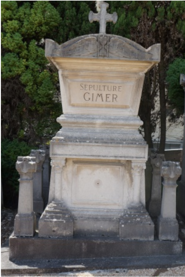
Tombeau familial Gimer à Triel

Incorporé au 36e régiment d'infanterie le 10 octobre 1905 et soldat 2e classe, le dit jour. Caporal le 26 septembre 1906. Sergent le 1er mai 1907. Envoyé dans la disponibilité le 28 septembre 1907. Passé dans la réserve le 1er octobre 1908. Rappelé à l'activité par suite de la mobilisation générale. Arrivé au corps le 5 août 1914. Décédé le 19 septembre 1914 à l'hôpital de Rennes des suites de blessure et de maladie.