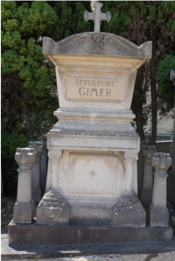
Tombeau familial Gimer à Triel

Incorporé au 36e régiment d'infanterie le 10 octobre 1905 et soldat 2e classe, le dit jour. Caporal le 26 septembre 1906. Sergent le 1er mai 1907. Envoyé dans la disponibilité le 28 septembre 1907. Passé dans la réserve le 1er octobre 1908. Rappelé à l'activité par suite de la mobilisation générale. Arrivé au corps le 5 août 1914. Décédé le 19 septembre 1914 à l'hôpital de Rennes des suites de blessure et de maladie.