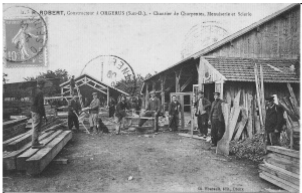
Orgerus, ets Robert, constructeur de hangar agricole