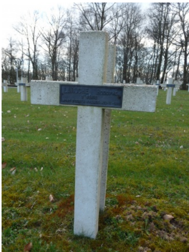
Cimetière du Vauquois - Argonne