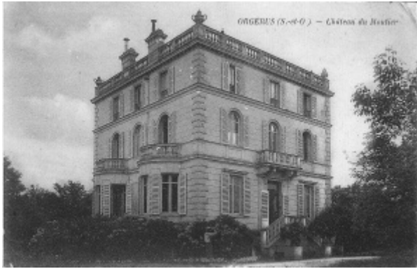
Château de Mont Plaisant au Moutier d'Orgerus