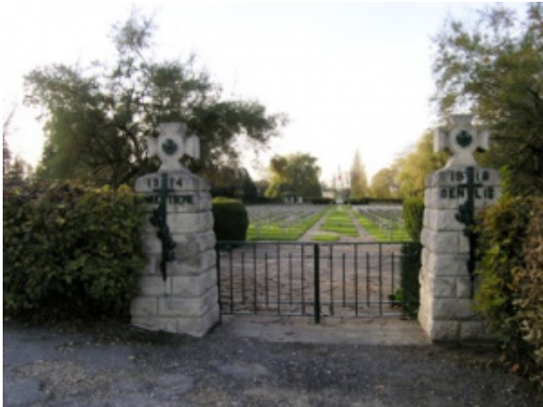
Cimetière militaire de Senlis

Incorporé au 115 e régiment d'infanterie, à compter du 9 octobre 1905. Arrivé au corps et soldat de 2 e classe le dit jour.