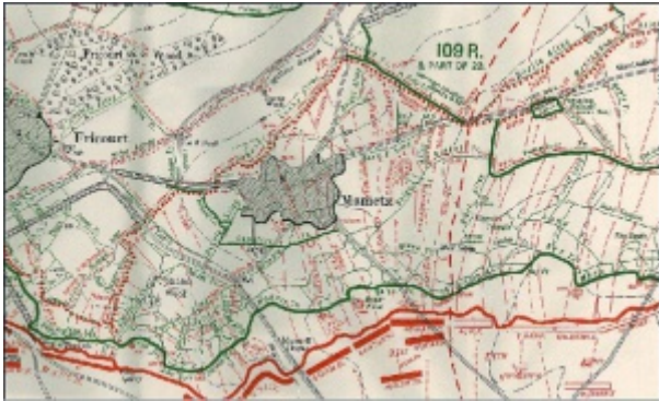
Mametz dans la Somme

Incorporé à compter du 19 novembre 1901. Affecté au 39e régiment d'infanterie. Soldat de 2e classe le dit jour.