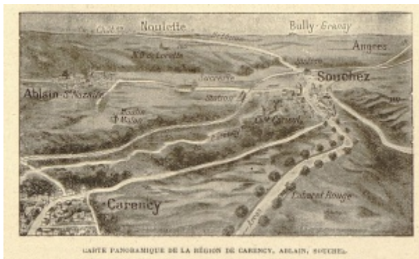
Noulette dans le Pas de Calais

Incorporé à compter du 16 novembre 1895. Arrivé au corps le dit jour. Passé au 162e régiment d'infanterie le 28 décembre 1895. Arrivé au corps le dit jour. Envoyé dans la disponibilité le 21 septembre 1898. Passé dans la réserve de l'armée active le 1er novembre 1898. Rappelé à l'activité par suite de la mobilisation générale. Arrivé le 13 août 1914 au 18e régiment territorial d'infanterie. Parti au front le 1er novembre 1914. Disparu le 26 mai 1915 à Noulette (Pas de Calais). Déclaré décédé le 26 mai 1915. Sépulture : Albain-Saint Nazaire (Pas de Calais) Nécropole Nationale « Notre Dame de Lorette » _ Tombe individuelle. Carré de la tombe (12). Rang de la tombe (1). Numéro de la tombe (2240).