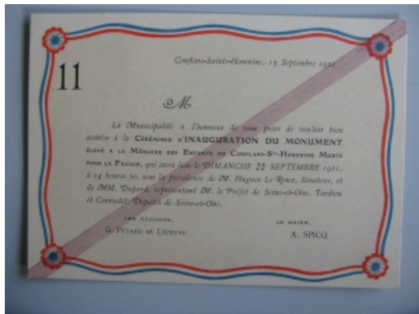
Carton d'invitation à l'inauguration

Son inauguration est retracée par Eugène Chabrot [6] :