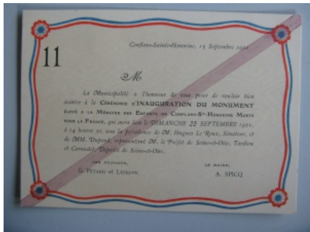
Carton d'invitation à l'inauguration

Son inauguration est retracée par Eugène Chabrot [6] :