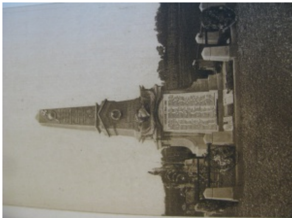
Monument aux morts de Conflans le jour de son inauguration

De Le Wiki de la Grande Guerre Aller à : navigation, rechercher