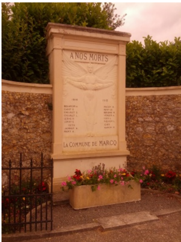
Monument aux morts de Marcq

Le souvenir des hommes de la commune décédés lors du conflit 14-18 est honoré par le monument aux morts, érigé devant la mairie et par une Plaque commémorative de l'église de Marcq, apposée au mur de l'Eglise.