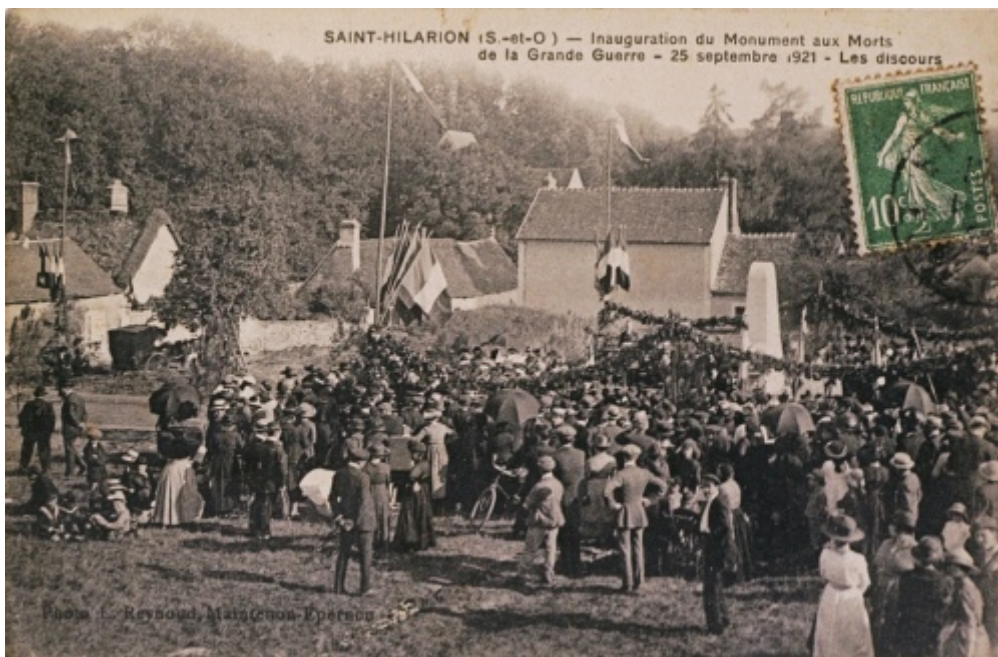
Inauguration du monument le 21/09/1921

grilles. Mais en 1968, le conseil municipal décide de supprimer les grilles.