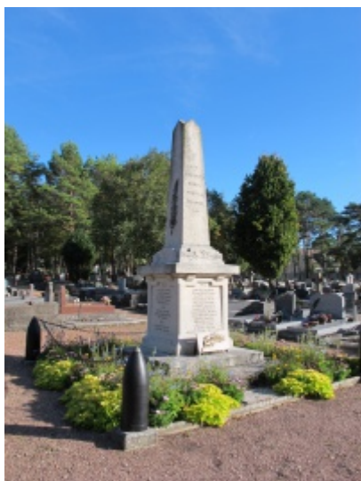
Monument aux morts de Saint-Michel-sur-Orge

Apparus après la guerre de 1870-1871, les monuments aux morts ont été élevés dans leur grande majorité à la suite de la guerre de 1914-1918. Celui de Saint-Michel sur Orge ne fait pas exception. C'est en effet lors de la séance du Conseil municipal du 7 octobre 1920 [1] que le plan et le devis sont présentés à l'Assemblée. Le monument vise à « glorifier les héros morts pour la patrie ».