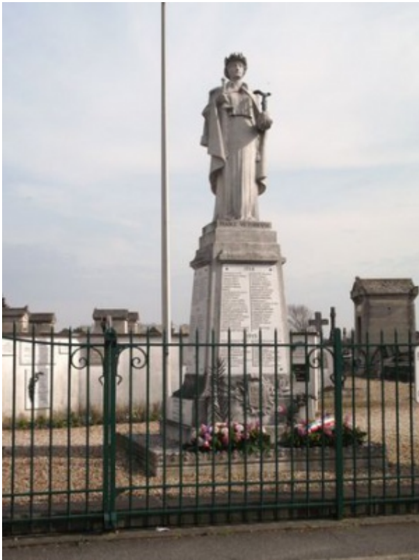
Monument aux morts de Sartrouville. Phot. Jean-François Python. Licence CC BY-NC-SA 2.0. Pas de réutilisation commerciale.

Pas de photographie entièrement libre de droits pour illustrer cet article, sauf si vous téléchargez la vôtre ! La photographie ci-contre provient du site MémorialGenWeb [7] .