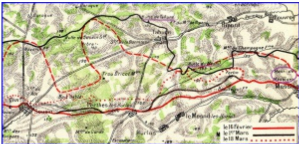
Souain dans la Marne