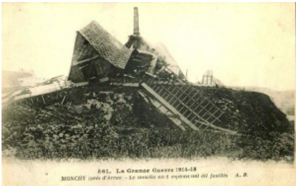
Monchy près d'Arras

Incorporé au 1er Régiment d'Infanterie à compter du 9 8bre 1907. Arrivé au corps le dit jour. Passé dans la disponibilité de l'armée active, le 25 septembre 1909.