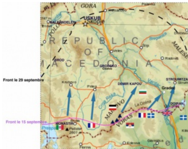
Uskub en Serbie

Incorporé le 9 octobre 1911 au 129e régiment d'infanterie. Arrivé au corps et soldat de 2e classe le dit jour. Soldat musicien.