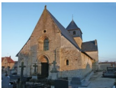
L'église et le cimetière d'Époye en 2003 [2]

En 1921, le village comptant 618 âmes, n’était redevable que de 309 francs.