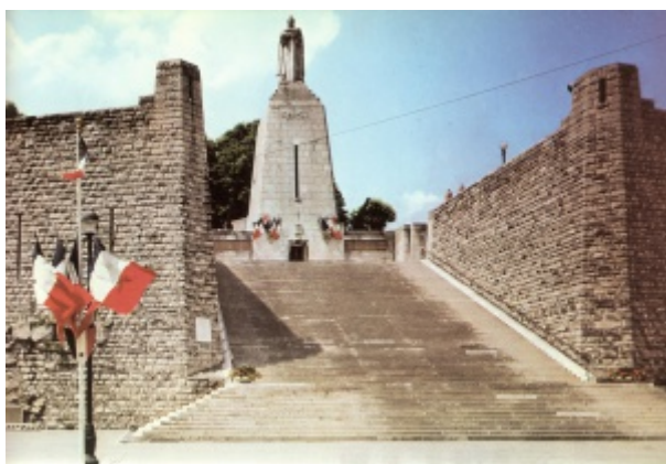
Monument à la Victoire à Verdun

En reconnaissance des subventions versées de 1921 à 1925, les deux Municipalités de Tramery et d'Époye reçoivent les " délégués de la Morraine ".