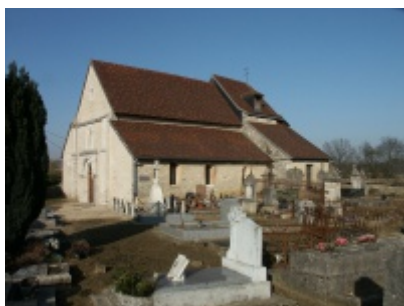
L'église et le cimetière de Tramery en 2003 [6]