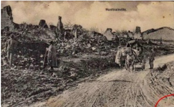
Montblainville dans la Meuse

Incorporé au 2e bataillon de chasseurs à pied, le 14 9bre 1902. Arrivé au corps et chasseur de 2e classe, le dit jour.