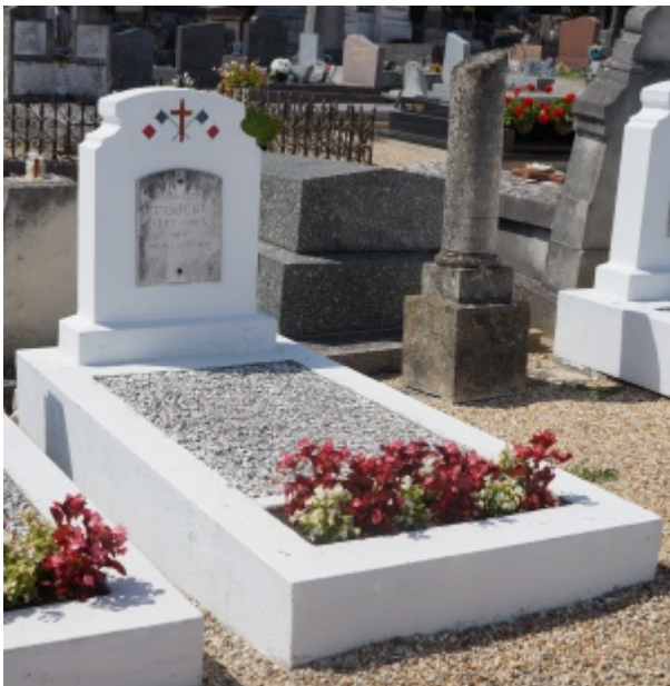
Tombe de Gaston Triquel dans le cimetière de Triel