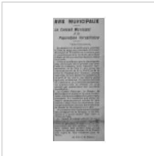
Détail de l'Echo de Versailles, 7 août 1914