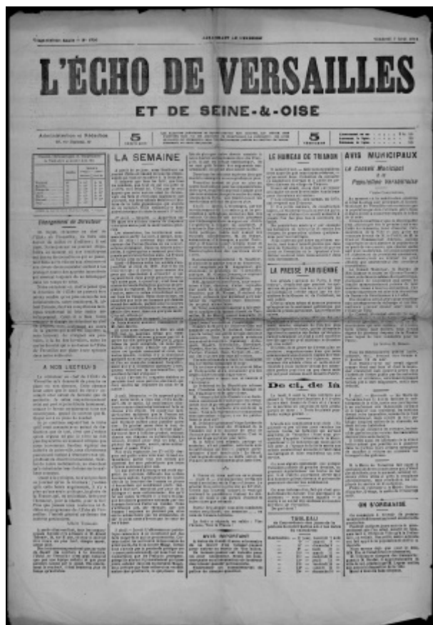
L'Echo de Versailles, 7 août 1914

De Le Wiki de la Grande Guerre Aller à : navigation, rechercher