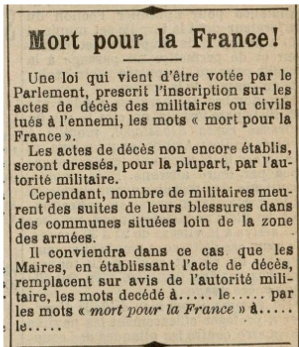
« Une mention mort pour la France », Le Petit Mantais, 4 août 1915, ADY 103J 21

De Le Wiki de la Grande Guerre Aller à : navigation, rechercher