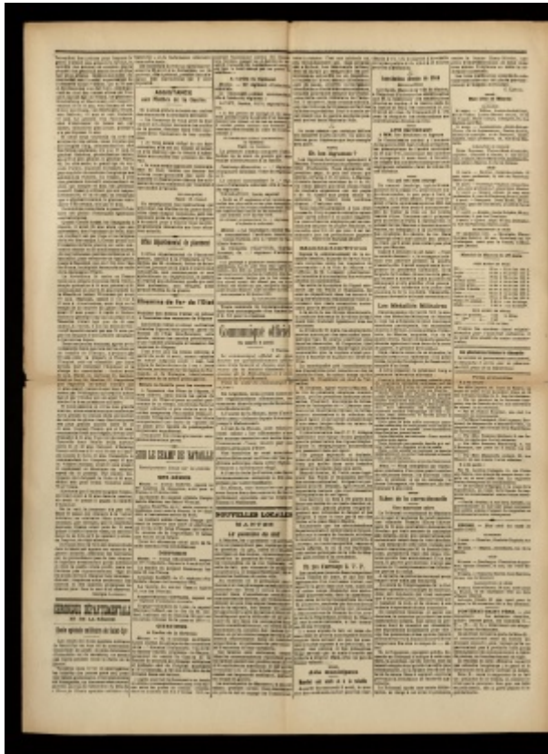
Le Petit Mantais, 05 avril 1916, page 2. ADY - PER 1063 /28

De Le Wiki de la Grande Guerre Aller à : navigation, rechercher