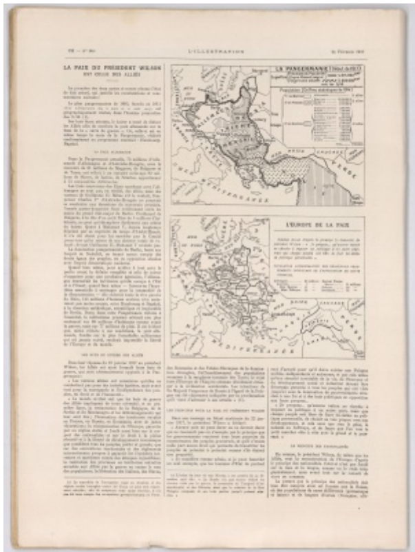
L'Illustration n°3860, 24 février 1917, article « La paix de Wilson » - ADY PER 3550

De Le Wiki de la Grande Guerre Aller à : navigation, rechercher