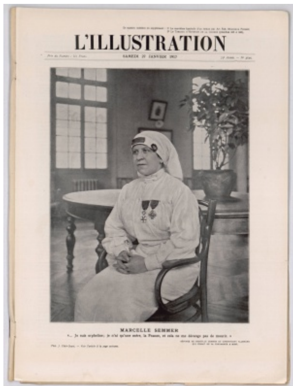
Couverture de L'Illustration, n°3586, 27 janvier 1917 - ADY PER 3550/7

Dans l'esprit de beaucoup, le métier d'infirmière correspond encore au début de la guerre à une transposition des tâches ménagères et d'un rôle maternel. Au fil du conflit, en reconnaissance de l'importance de leur travail, les infirmières sont décorées. Ainsi parmi les femmes médaillées de guerre la moitié sont des infirmières.