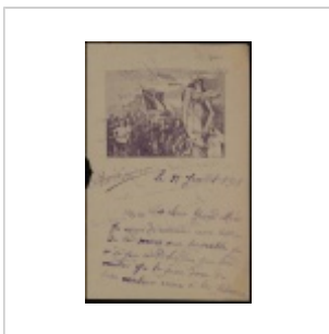
Lettre d'un soldat à sa grand-mère, 28 juillet 1918 - ADY cote 6Hdépôt 56