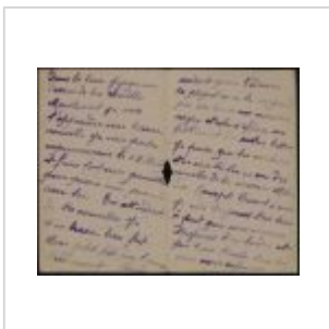
Lettre d'un soldat à sa grand-mère, page 2-3, 28 juillet 1918 - ADY cote 6Hdépôt 56