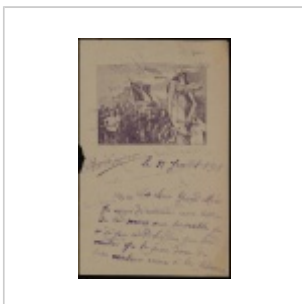
Lettre d'un soldat à sa grand-mère, 28 juillet 1918 - ADY cote 6Hdépôt 56