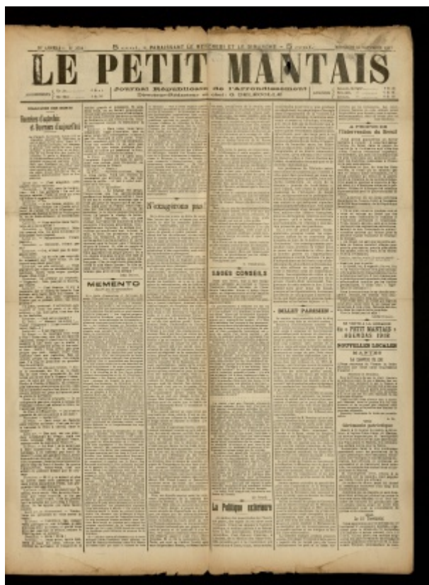
« Guerriers d'autrefois et guerriers d'aujourd'hui », Le Petit Mantais, 14 novembre 1917. ADY - PER 1063

De Le Wiki de la Grande Guerre Aller à : navigation, rechercher