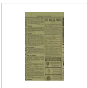
Détail du Journal de Mantes, 16 septembre 1914